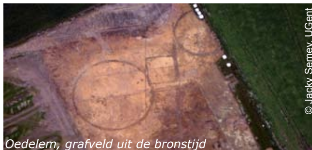
Oedeleem, grafveld uit de bronstijd