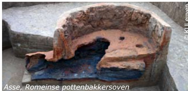
Asse, Romeinse pottenbakkersoven