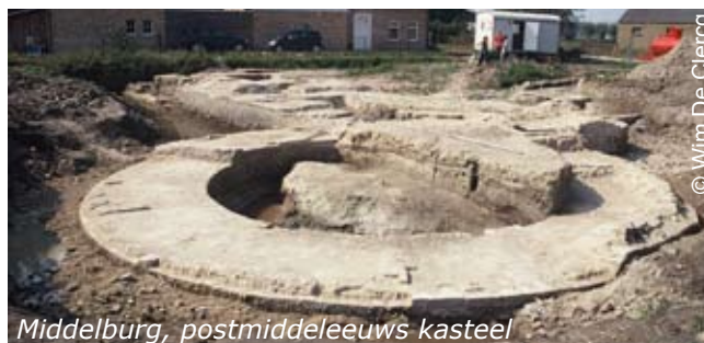
Middelburg, postmiddeleeuws kasteel